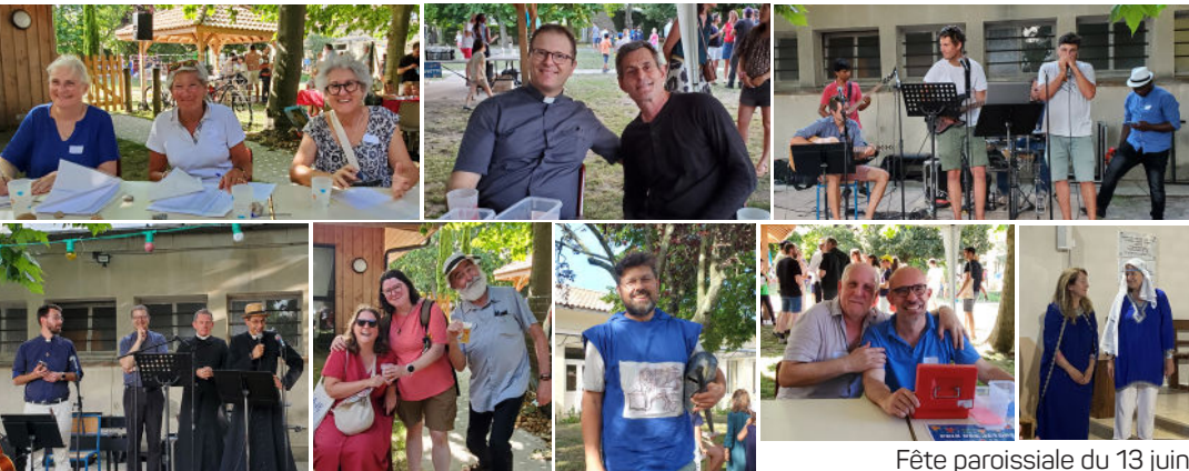
Fête paroissiale du 13 juin