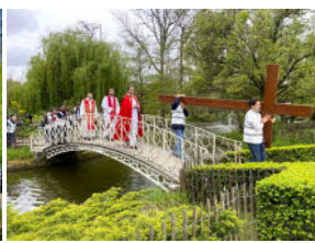
Rameaux et Chemin de croix au Parc Peixotto