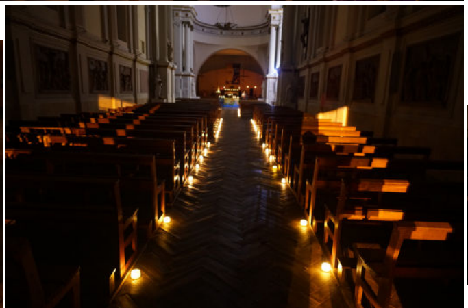
Messes rorate les mercredis pendant l'Avent