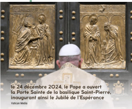
Le 24 décembre 2024, le Pape a ouvert la Porte Sainte de la basilique Saint-Pierre, inaugurant ainsi le Jubilé de l'Espérance

Retrouvez la bulle d'indiction dans son intégralité sur bordeaux.catholique.fr/jubile-2025