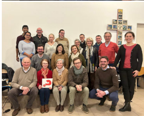
Galette des serveurs le 19 janvier