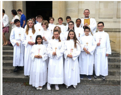
Premières communions et professions de foi les 2 et 9 juin