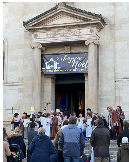
Mission de Noël 16-17 décembre 2023