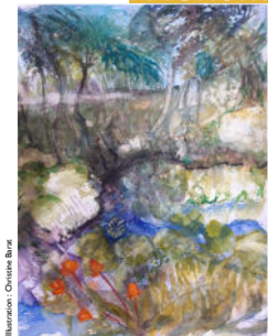
Illustration : Christine Biret