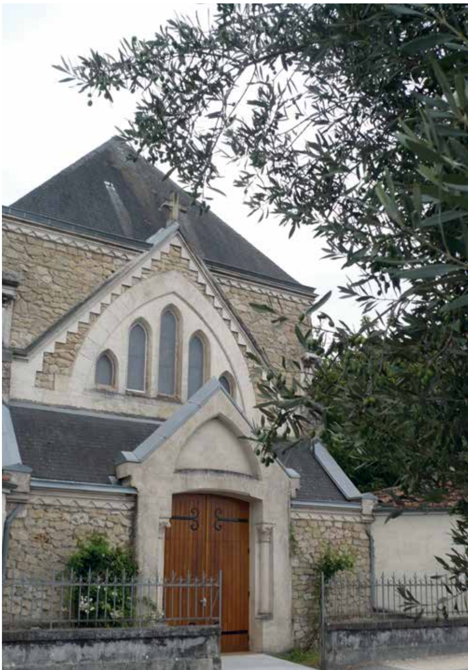
Entrée de la chapelle du Carmel.

D'après les informations de sœur Marie-Joëlle, prieure du Carmel