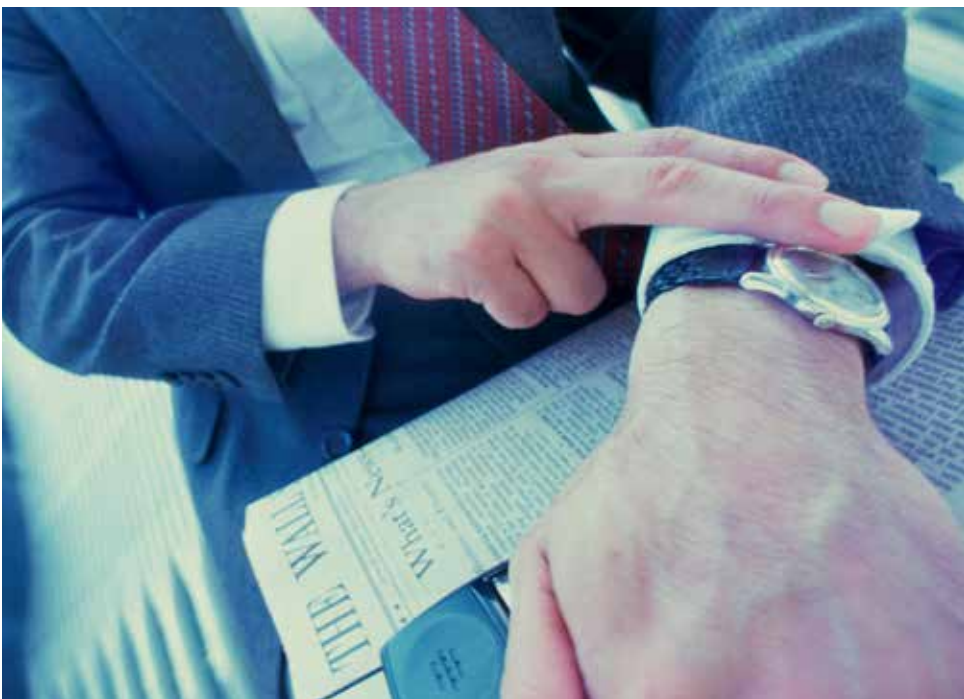
Quand le temps semble manquer.

Propos recueillis par Françoise Métivier