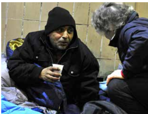
La situation des personnes contraintes de dormir dans la rue : la manifestation la plus criante de l'absence de logement personnel.

Sources: Livret d'information « Et toi, c'est quoi ton toit ? »