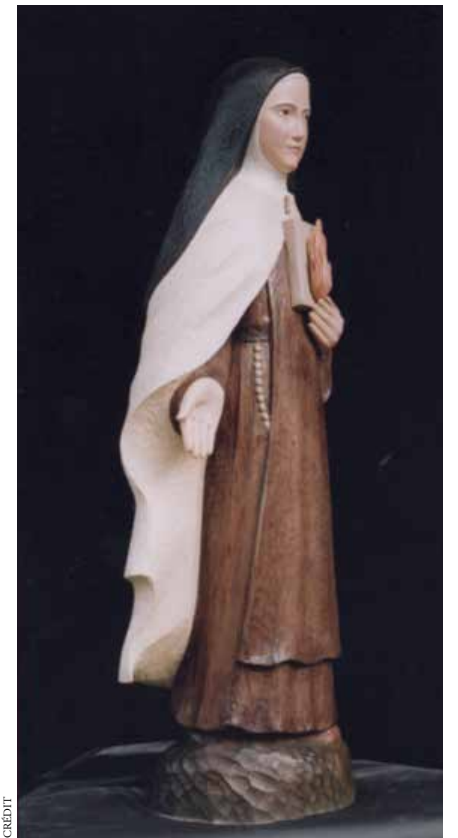
Sculpture en bois de sainte Thérèse de Lisieux, présente à la chapelle du Carmel.

Le Carmel de Bordeaux a été fondé en 1610. Une carmélite espagnole venue en France en 1604, à la demande du cardinal de Bérulle, choisit sept religieuses pour l'accompagner dans la fondation du nouveau Carmel de Bordeaux. L'afflux de vocations est tel qu'un second Carmel est fondé en 1618. Les deux monastères perdurent jusqu'à la Révolution puis se regroupèrent en un seul. En 1881, ce sera la construction du Carmel, rue Saint-Genès, à l'emplacement de l'actuel Séminaire et Maison Saint-Louis-Beaulieu. Suite à la loi de 1901 relative à l'expulsion des congrégations et ordres religieux, les carmélites s'exilent en Espagne, à Zarauz. À leur retour en France, elles s'établissent à Talence, sur la propriété Montaigu, juste derrière l'église Notre-Dame. C'est le 24 avril 1928 que toute la communauté s'y installa. Bientôt 90 ans de présence au cœur de la ville !